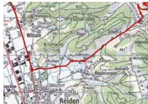
Streckenabschnitt durch die Gemeinde Reiden

Der Gemeinderat Reiden bittet im Namen des OK Powerman Zofingen um Verständnis für die Verkehrsbehinderungen während des Rennens. Weiter wünscht er dem OK Powerman Zofingen ein reibungsloses Rennen und einen tollen Anlass.