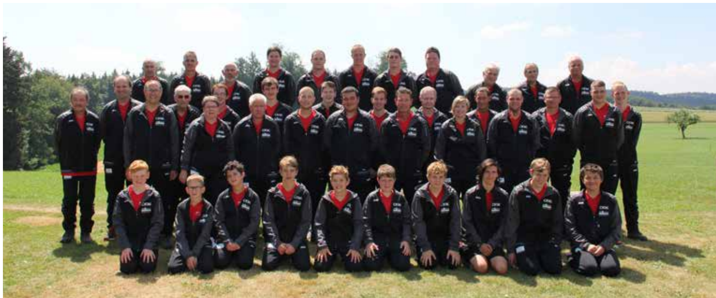
Hornussergesellschaft Hintermoos Reiden (A/B/NWH) mit neuem Trainer zum 100 Jahr Jubiläum