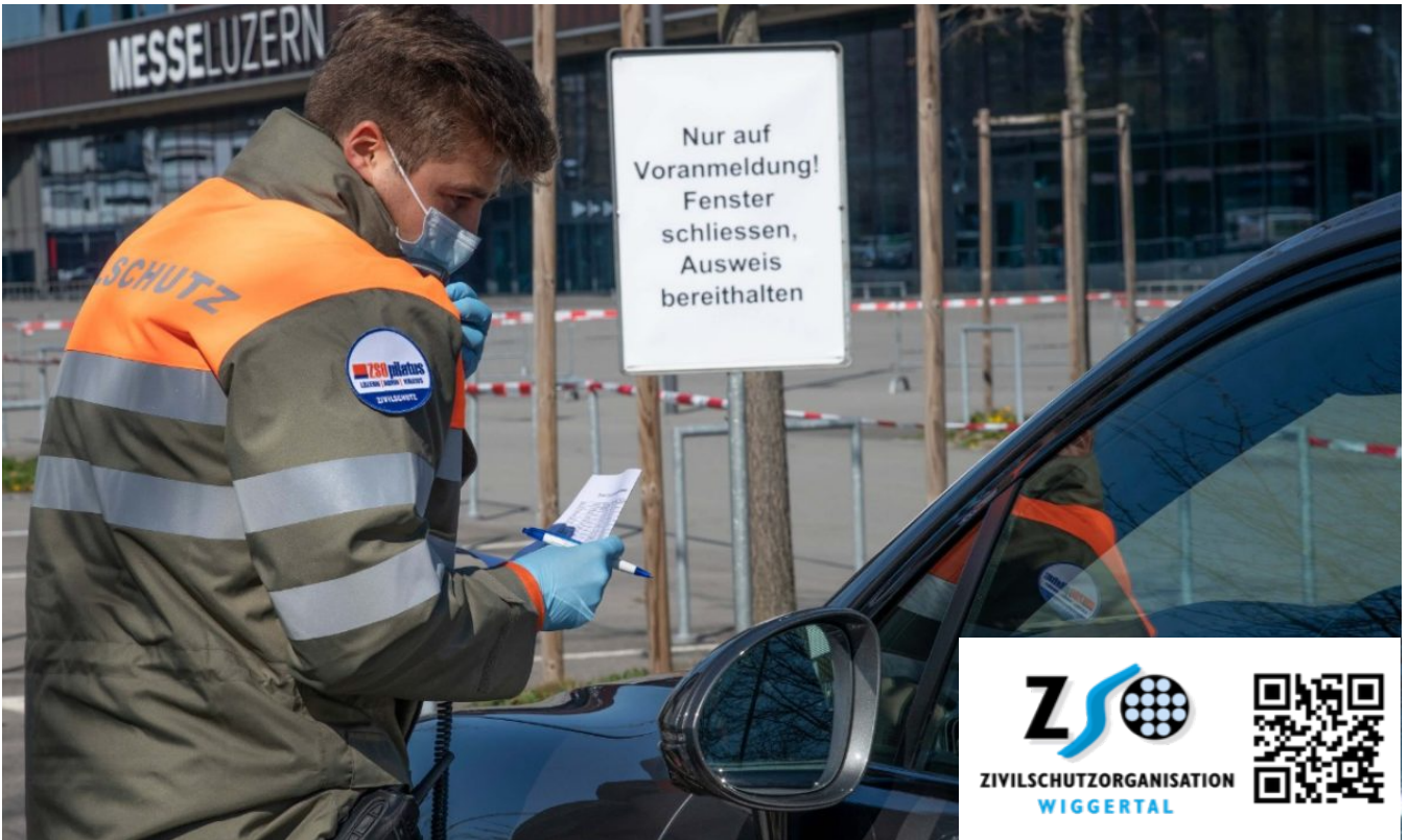
ID-Kontrolle vor dem Drive-In-Testing