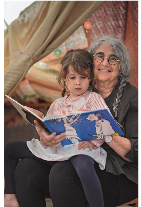
Gemeinsam stärker. Dafür sorgen wir. Auch in Zukunft». Vielen Dank für Ihre Spende.

und Senioren in der Schweiz möglichst lange am gesellschaftlichen Leben teilnehmen können, auch in schwierigen Zeiten. ●