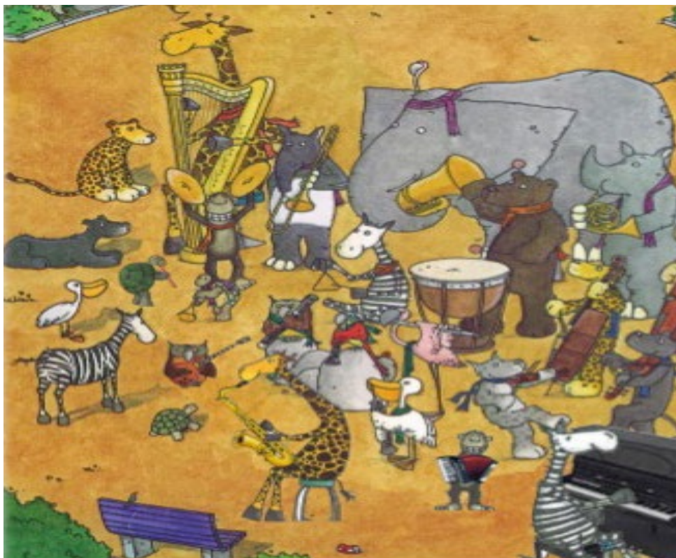
Das diesjährige Motto der Musikschule ist «Musikzoo – Zoomusik».

Natürlich ist es aufregender, die Instrumente selbst auszuprobieren und nicht nur beim Spielen zuzuhören. Deswegen wird es gleich am Abend die Möglichkeit geben, die Instrumente im Schulhaus Pestalozzi in Reiden von 18.00 – 20.00 auszuprobieren. Zugleich können Fragen zur Instrumentenwahl und zum Musikunterricht von den Musiklehrerinnen und Musiklehrern beantwortet werden. Alle Eltern und Kinder sind herzlich willkommen, in die bezaubernde Welt der Musik und Musikinstrumente einzutauchen. ●