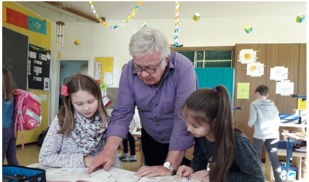
Seniorinnen und Senioren helfen im Unterricht aktiv mit.

Sind Sie über 60 Jahre alt und suchen Sie eine neue Herausforderung? Dann sind Sie in unseren Klassen herzlich willkommen! Nehmen Sie unverbindlich Kontakt mit der Schulleitung (062 758 33 75) auf oder informieren Sie sich bei der Pro Senectute ( www.lu.pro-senectute.ch ), um weitere Informationen über das Projekt zu erhalten. Wir freuen uns auf Sie!