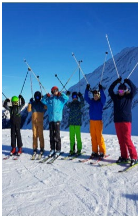
Die 5./6. Klassen geniessen den Schnee bei Sonnenschein.

Müde, aber gesund und munter kehrten die Schülerinnen und Schüler nach einem aufregenden Tag zurück nach Hause.