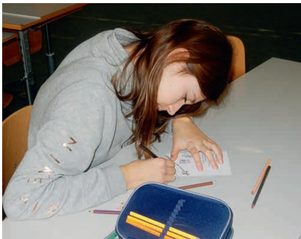
Eine Fünftklässlerin gestaltet einen Flyer für das Musical «Wär?»

Trotz aller Massnahmen gibt es hochbegabte Lernende, die Kapazitäten für weitere Leistungen haben, als in der Regelschule gefördert werden können. Für hochbegabte Lernende und Lernende mit überdurchschnittlichen Leistungen bietet der Kanton Luzern seit diesem Schuljahr Ateliers für Hochbegabte an. Dabei besuchen Lernende der 3. bis 6. Primarklasse einmal pro Woche an einem Nachmittag ein Atelier in Luzern oder Sursee. Während dieser Zeit sind die Kinder vom Unterricht in ihrer Klasse dispensiert. In diesem Schuljahr werden acht verschiedene Ateliers angeboten, für welche die Lernenden mit einer Hochbegabung bei der Anmeldung ihre Prioritäten angeben können. So können beispielsweise knifflige Rätsel aus den Bereichen Mathematik und Informatik gelöst, die chinesischen Schriftzeichen erlernt, unterschiedliche Zeichen-Ideen und -Techniken ausprobiert sowie verschiedene Robotermodelle programmiert werden. Zwei Kinder der Primarschule Reiden dürfen ein Atelier zum Philosophieren besuchen, bei dem insbesondere die Freude am Denken und Diskutieren gefördert wird. ●