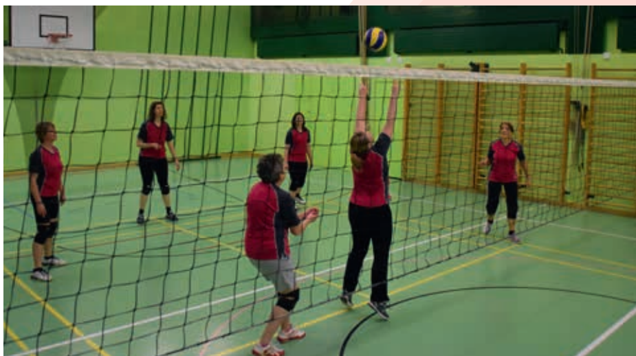
Das Volley-Team Langnau in Action.