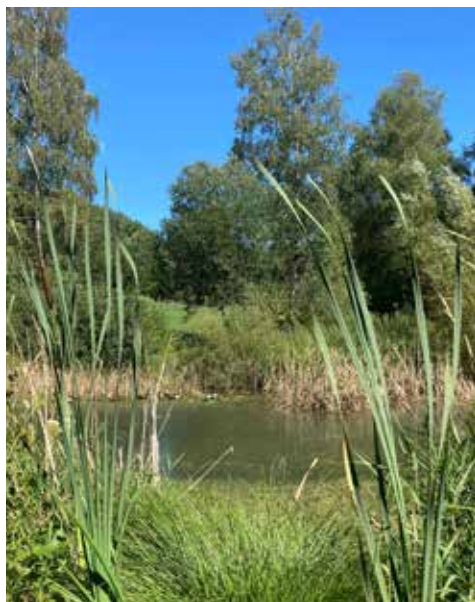
Idylle bei der Weihermatte

Die Weihermatte am südöstlichen Dorfrand gelegen, bildet das Herzstück der 5 verschiedenen Lebensräume, denen sich NaturReiden speziell annimmt. Dieses ca. 2 ha grosse, seit