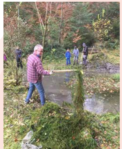
Vereinsmitglieder packen in Richenthal tatkräftig zu.