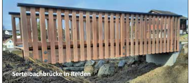
Sertelbachbrücke in Reiden

Wir begleiten Sie von der Planung bis zur Ausführung.