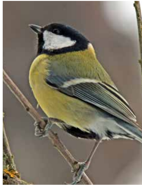
Farbenfrohe Vogelwelt – die Kohlmeise