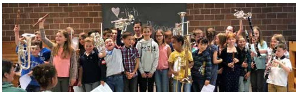
Strahlende Gesichter nach dem Beginnerkonzert.

Eine Ausbildung, die Musik miteinschliesst, bedeutet eine zusätzliche Zeit- und finanzielle Investition. Diese lohnt sich aber, denn es hat sich ebenfalls gezeigt, dass die Kinder mit Musikunterricht tendenziell bessere Leistungen in anderen schulischen Fächern erbracht haben. Neben der Freude am Musizieren hat der Besuch einer Musikschule also auch viele positive Nebenwirkungen. Wichtige Persönlichkeitsmerkmale wie Kreativität, Konzentration, Teamfähigkeit, Intelligenz und emotionale Stabilität werden gefördert und ausgebildet. All diese Kompetenzen, die im Musikunterricht erlangt werden können, sind für unsere Absolventen im späteren Berufsleben nur von Vorteil, denn vergessen Sie nicht – Kreativität ist eine der letzten Bastillen, die den Menschen bleibt und die vielleicht einzige wertvolle Ressource, die Unternehmen haben.