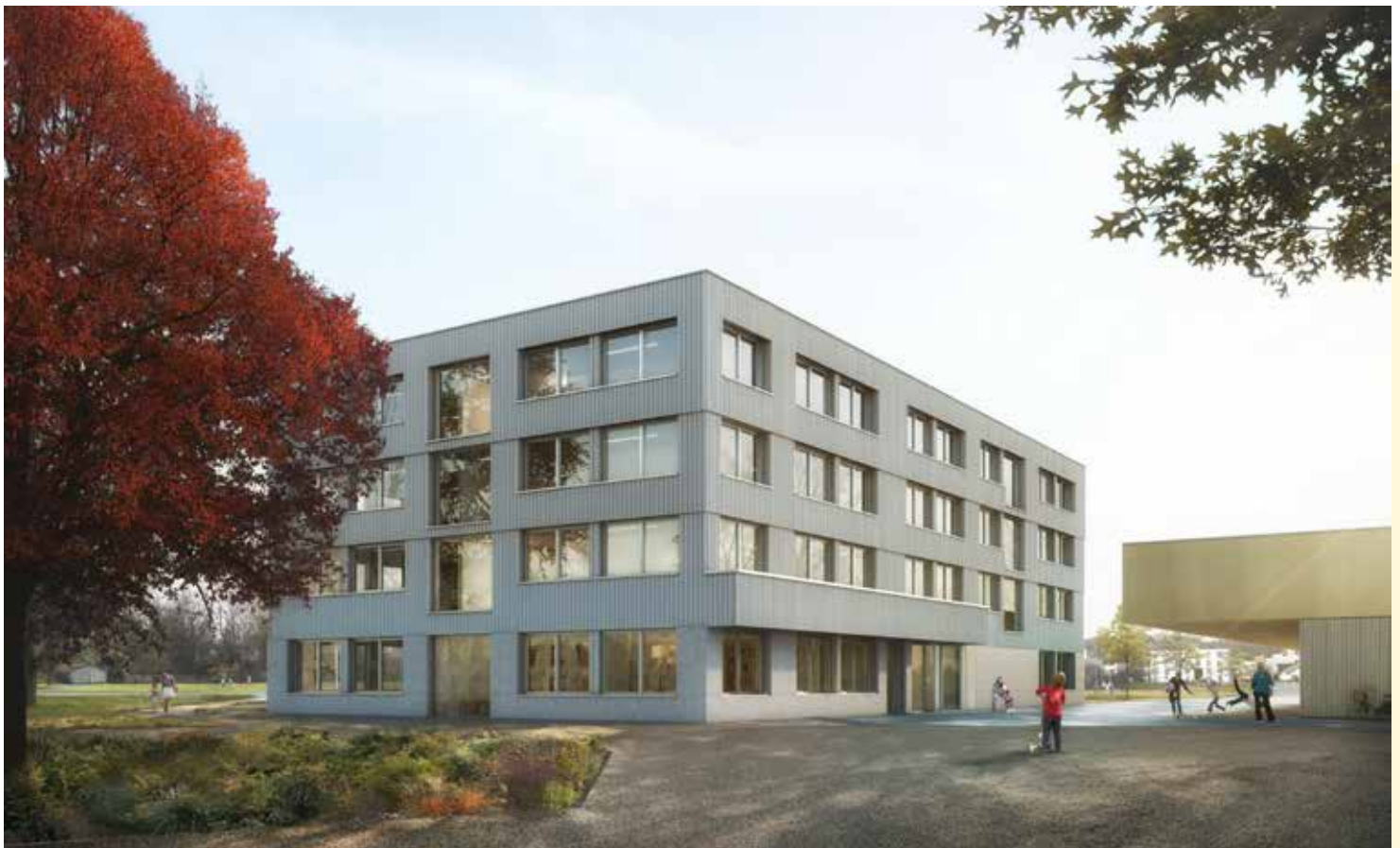
Visualisierung Schulhaus Reiden