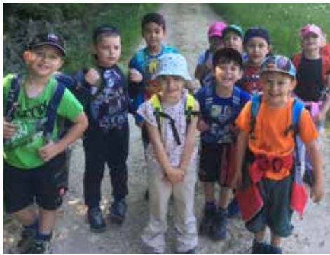
Gross und Klein freuen sich über den sonnigen Wandertag.

Beim gemeinsamen Picknick am Mittag konnten die Energiespeicher wieder aufgefüllt und die müden Beine entspannt werden. Trotz der Müdigkeit verging nur wenig Zeit und die Schülerinnen und Schüler waren schon wieder mit Hütten bauen und Spielen beschäftigt.