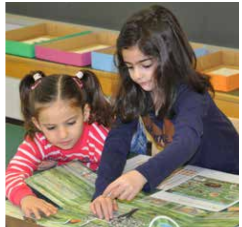
Im Kindergarten wird mit entwicklungsorientierten Zugängen gearbeitet.

Eine grossangelegte Studie in Berlin hat gezeigt, dass Musizieren Kinder kreativ und sozial kompetent macht. So konnte nachgewie-