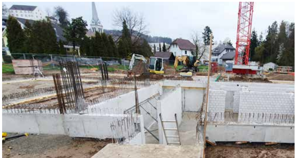
Kellergeschoss (Stand: Mitte April 2019)

Geht alles weiterhin nach Plan, ist der Neubau im Sommer 2020 bezugsbereit. Der Schulbetrieb wird damit für das Schuljahr 2020/21 im neuen Schulhaus starten. ●