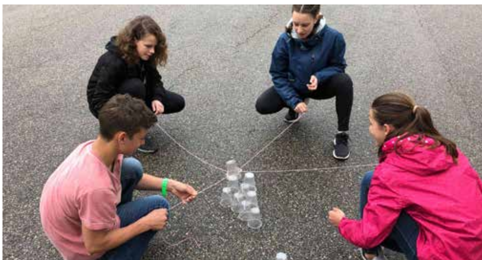
Olympische Spiele in Reiden

In der 2. KSS absolvieren die Jugendlichen an zwei Tagen die Stellwerk-Vergleichstests in den Fächern Mathematik, Deutsch, Englisch, Französisch und Vorstellungsvermögen. Als Gegenpol zu diesen intensiven Tagen wurden Olympische Spiele in Reiden durchgeführt, mit teamfördernden und kreativen Spielen wie zum Beispiel «Pyramidenbau», welcher nur im Team und nicht als Einzelleistung lösbar ist. Der letzte Tag stand im Zeichen der Energie, welche in Rathausen am eigenen Leib erfahren werden durfte.