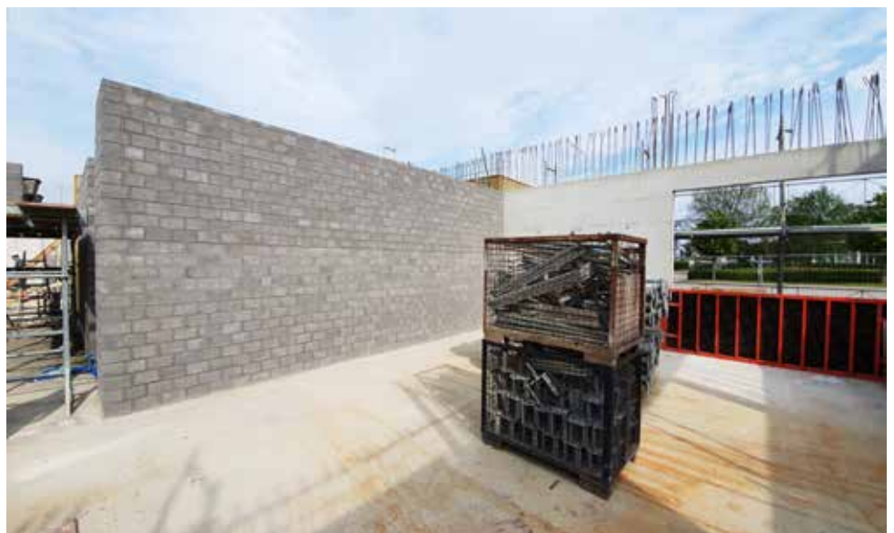
Sichtmauerwerk und Aussenwand (Stand: Mitte Mai 2019)