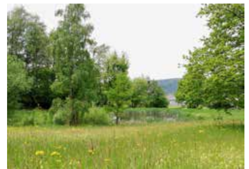
Weihermatte Reiden (Mai 2019)

Die Weihermatte ist ein Riedgebiet, durchzogen vom natürlichen Bachlauf der Sertel, am südlichen Siedlungsrand von Reiden. Im Zentrum liegen zwei Weiher, die ein gutes Amphibienlaichgebiet sind. Die Weihermatte gehört der Gemeinde Reiden, ist aber durch einen Dienstbarkeitsvertrag mit Pro Natura geschützt. Die umliegenden Wege führen Sie direkt zum Schutzgebiet. Sitzbänke laden zum Verweilen und Beobachten ein. ●