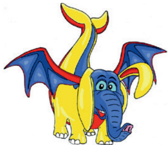
SAM – unser LOGO und Maskottchen

Seit gut zwei Jahren ist die Primarschule Reiden mit dem Schulentwicklungsprojekt SAM (Schule Anders Machen) unterwegs. Wir berichteten in der Dezemberausgabe 2021 darüber. In der Zwischenzeit wurden viele kleinere und grössere SAM-Projekte in einzelnen Klassen, aber auch in ganzen Stufen oder Schulhäusern durchgeführt. Wir werden Ihnen nun sporadisch im Reiden Magazin Projekte vorstellen, die sich bereits etabliert haben.