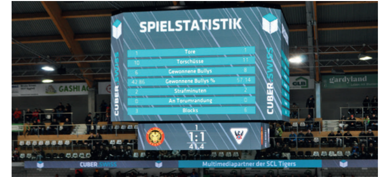
LED Würfel und LED Bande in der emmental versicherung arena Langnau (BE)