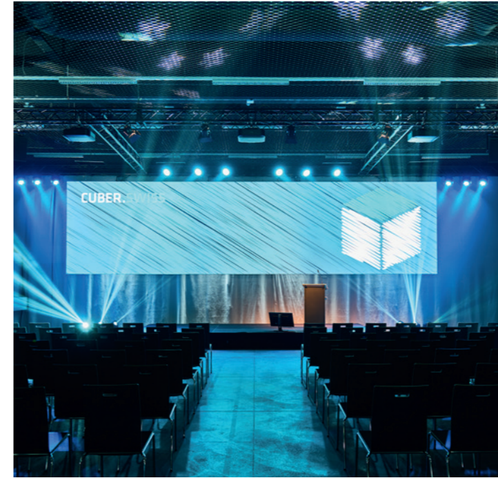
Projektion im Tigersaal