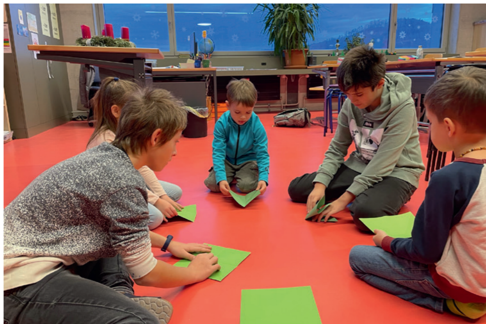
6. Klässler helfen Kindergärtner beim Falten

übernommen und waren ganz grossartige Vorbilder. Es fanden mehrere gemeinsame Lektionen statt: Bilderbücher vorlesen, Bastelspass vor Weihnachten oder gemeinsames Singen und Spielen stand auf dem Programm. Eine Bereicherung sind solche Lektionen für die Kleinen und für die Grossen. Alle Beteiligten können wertvolle Erfahrungen mitnehmen.