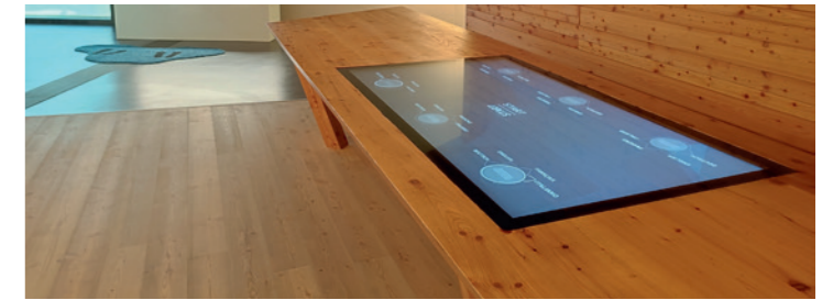
Touchscreen im World Nature Forum Naters (VS)