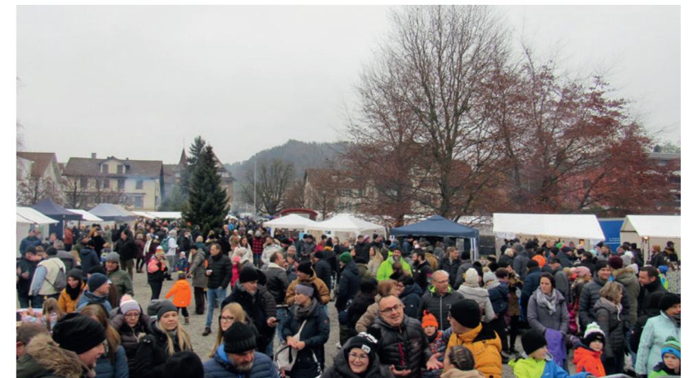
Rund 40 Stände, viel Unterhaltung und die Geselligkeit werden auch dieses Jahr den Reider Weihnachtsmarkt auszeichnen.