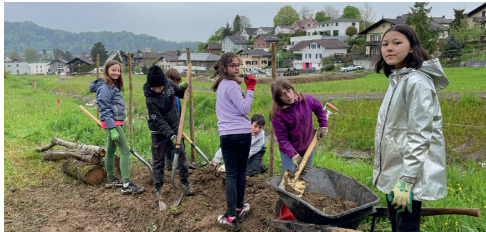
Schüler der 6. Klasse helfen beim Bäume pflanzen

Der Wald, weil ihn Kinder schätzen und lieben lernen und besser verstehen. Die Schule, weil der Wald und die Natur für ganzheitliches und erfahrungsbasiertes Lernen ideale Lernorte sind, und die gesunde Entwicklung der Kinder fördert. Gerne helfen wir mit der Klasse 6a, Neophyten zu entfernen; leisten in der Weihermatte einen Beitrag zur Erweiterung und Pflege des Naturschutzgebietes oder sind mit dem Förster auf Tierspuren im Wald. Natürlich gehört auch die Artenkenntnis verschiedenster einheimischer Pflanzen dazu. Wo lernt man das besser als draussen inmitten der Bäume und Sträucher?