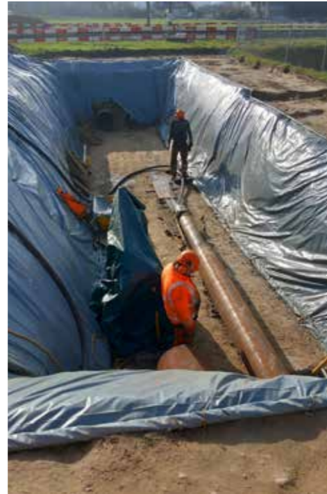
Unterstossung für den Verbundschacht der Wasserversorgung

notwendig, damit allfällige Engpässe überbrückt werden können, so dass die Qualität des Trinkwassers weiter die erforderlichen Standards erfüllen kann.