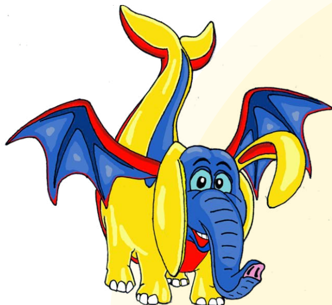
SAM als Logo