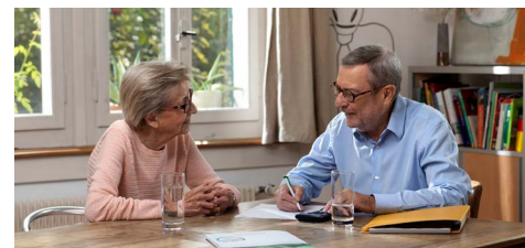
Spendenergebnis der Herbstsammlung 2021 in Richenthal