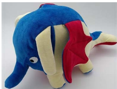
SAM als Plüschtier

Die ganze Primarschule ist gespannt, wohin uns diese Reise führt.